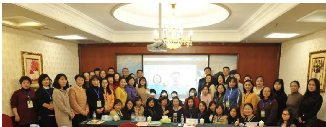
培训班所有学员与教育部领导以及远在香港的基金会总干事戴大为先生、李泽吟女士合影留念