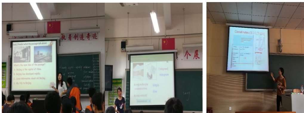
黄宇老师对这 4 堂课和教师们一起进行了研讨点评并还分享康奈尔笔记法，规范学生的上课笔记

黄宇老师上周四共听取了王浪、王佳常、刘冰容、易娟这四位老师的课，分别为 3 节阅读课和 1 节听力课。她很高兴北碚田中的老师都很人情和开明，老师们都十分欢迎她走进课堂。黄宇老师很惊喜地发现，这四位英语教师都能够用很流利的口语全英文授课，在教读单词时也具备了语音意识和拼读意识，课堂过程中也能够搭建脚手架，引领学生前行，最后还能和学生分享教学目标，让学生对本节课有更清晰的认识。易娟老师很注意培养学生的学习习惯，她的课前会有学生带领读书，让注意力更为集中。刘冰容老师用北京这十年变迁的视频最为上课的引入，学生们一下就有了兴趣。王佳常老师用当天的良好天气过渡到了做运动，上课的过程很流畅。王浪老师重视学生能力的培养，让学生分享 5 个新单词，充分发挥学生的主体作用，真正掌握知识。