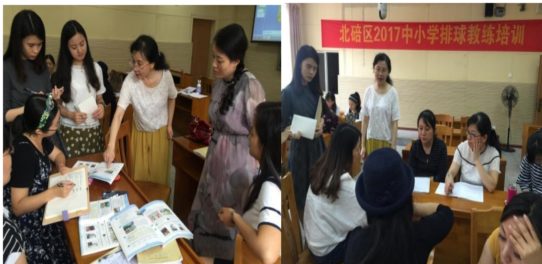
图为杨老师倾听、指导各年级的老师讨论备课组计划

讨论之后各年级老师代表发表了自己组的意见。特别是初一年级的语音教学，杨老师给予了细致的讲解，初一年级老师也提出了自己在教学中的问题并且得到了杨老师及时的解决。初三年级的阅读练习也制定了可行有效的练习方法。