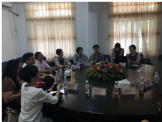
在教育厅幼儿园与幼儿园管理团队 座谈