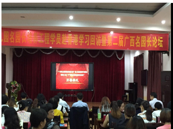
论坛开幕典礼现场