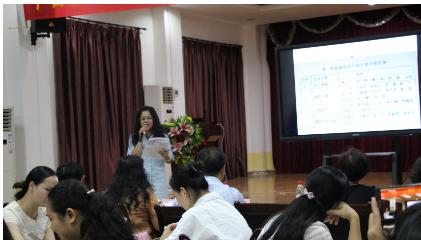
第二批赴港园长汇报行动方案

活动第一环节，第二批赴港学习的20名园长及12名教研员分为了五大领域、课程实施、环境施舍及教师专业发展四个不同主题的小组，并展开了时长为1小时的小组讨论。在讨论的过程中，学员们对组内成员行动计划实施的进程和困惑均有所了解，并彼此交换了意见。活动第二环节，每个小组的组长或组员向嘉宾和其他学员汇报该组的总