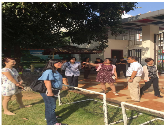
考察教育厅幼儿园的户外游戏区域 规划与创设