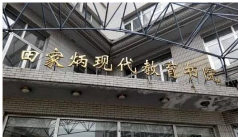
哈尔滨师范大学田家炳现代教育书院

饮水思源，田家炳先生一生高风亮节、无私奉献的精神将永远传承在哈尔滨师范大学传媒学院的万千莘莘学子心中。今后，传媒学院将进一步加强与田家炳基金会的交流合作，以“田家炳传媒文化教育研究中心”为纽带，共同为教育事业做出更大贡献！