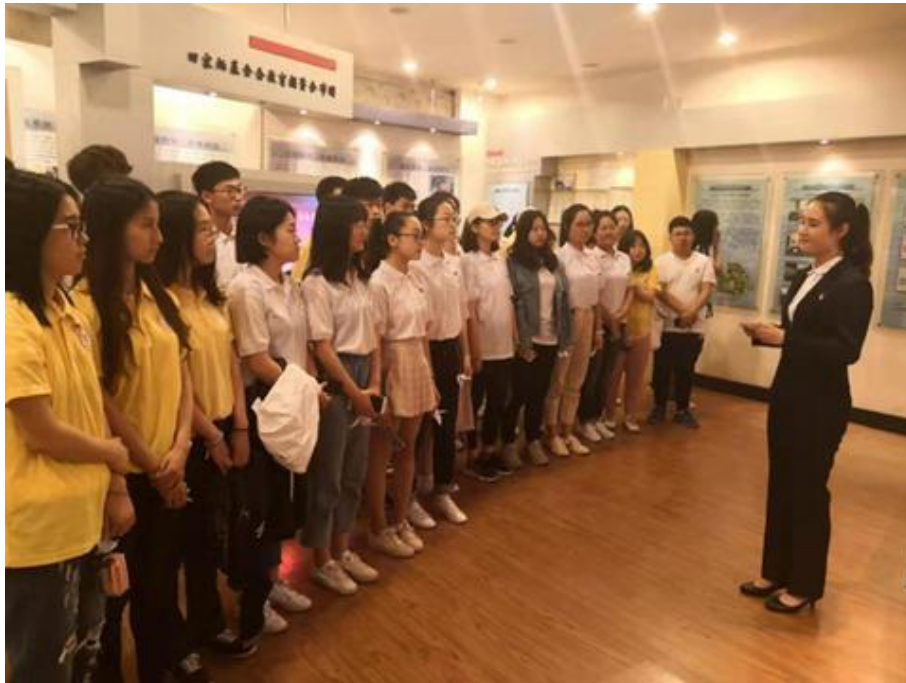
“田家炳的故事”志愿讲解团组织学生参观田家炳荣誉展室

该学院所在教学楼由田家炳捐建，田家炳生前曾多次到访沈阳师范大学，出席落成典礼、亲笔题词、植下纪念树，并为师生作报告。在该教学楼一楼大厅，陈列着国内规模最大的一幅田家炳先生浮雕造像。多年来，该学院与田家炳基金会一直保持着密切联系与合作。田家炳先生逝世后，该学院师生举行了悼念活动。