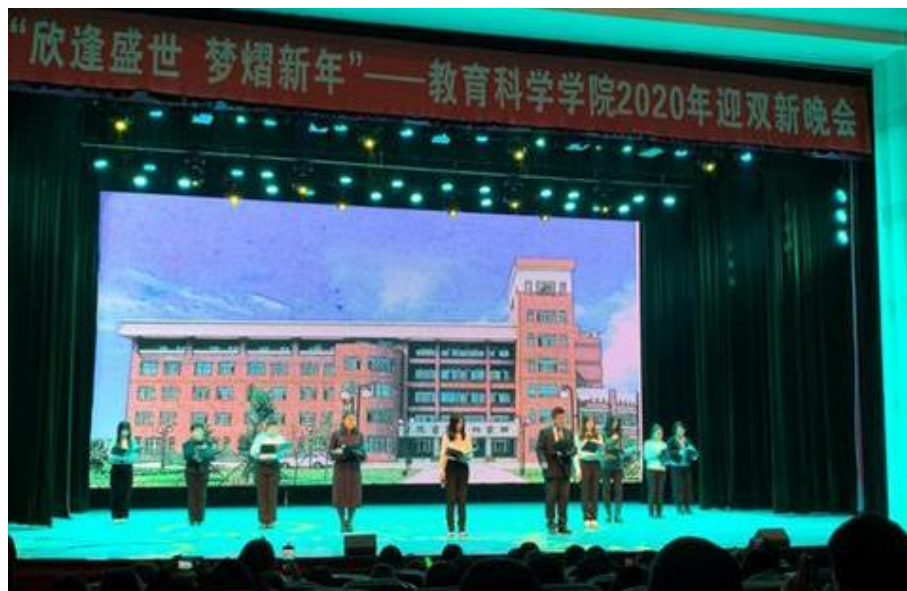
沈阳师范大学教育科学学院师生共同表演配乐诗朗诵《家炳星灿烂》

诗朗诵由学生自主创意，根据田家炳先生生平事迹和相关资料改编、创作，歌颂了田家炳助学兴教的大爱精神，表达了学院师生饮水思源的感恩怀念之情。参加演出的有学院领导、本科生导师和学生代表，他们的朗诵情真意切，感动全场。观看演出的师生表示，诗朗诵感情真、情怀深，很有教育意义，听得热泪盈眶。诗朗诵节目寓教于乐，让整场新年晚会更加富于内涵，更加凸显学院特色，还得到田家炳基金会总干事戴大为先生的关注和肯定，并把演出视频分享给了田家炳家人。