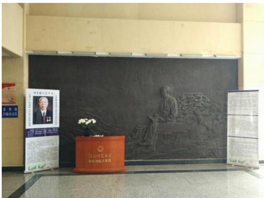
沈阳师范大学田家炳教育书院陈列的田家炳先生浮雕造像