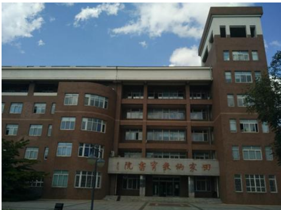
田家炳捐建的沈阳师范大学田家炳教育书院