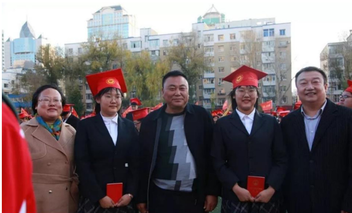
(于利合校长与学生及学生家长合影)