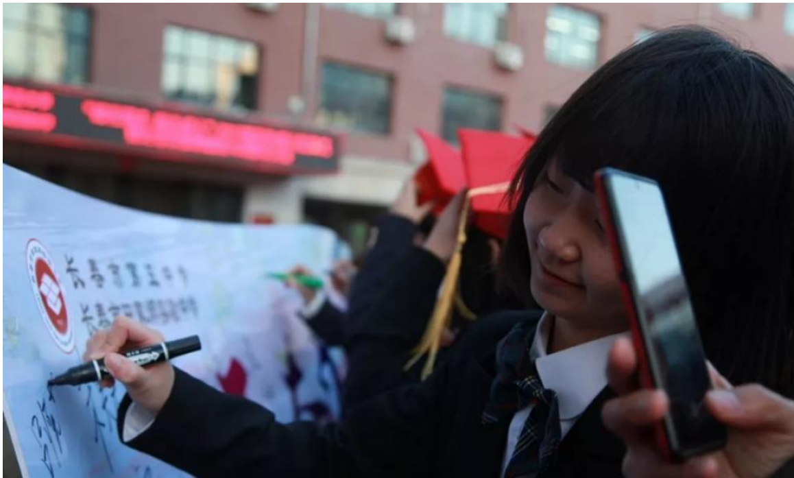
(学生在成人纪念板上签名)

通过系列活动，学生们感受到了父母的期盼，感悟到了成人的责任，明确了远大的理想。在田家炳先生诞辰 100 周年之际，我校举行系列活动，既是深切怀念、追思高风亮节的田家炳先生，更让田中学子深刻理解了成人的意义，将来以造福桑梓、报效国家为己任，成为复兴民族圆梦中华的栋梁！