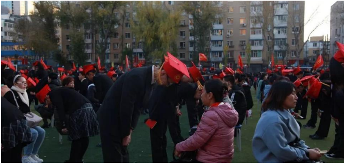
(学生向家长行感恩礼)