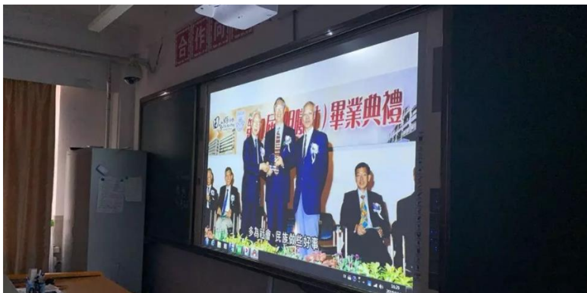
(学习田家炳精神主题班会)

10 月 25 日下午，全校各班级召开了学习田家炳精神的主题班会，班会内容丰富，形式多样，学生们以朗诵、视频、故事等形式传颂田公事迹，缅怀田公精神。同学们纷纷表示将来也要像田家炳先生一样造福桑梓、回报父母、家乡和祖国。