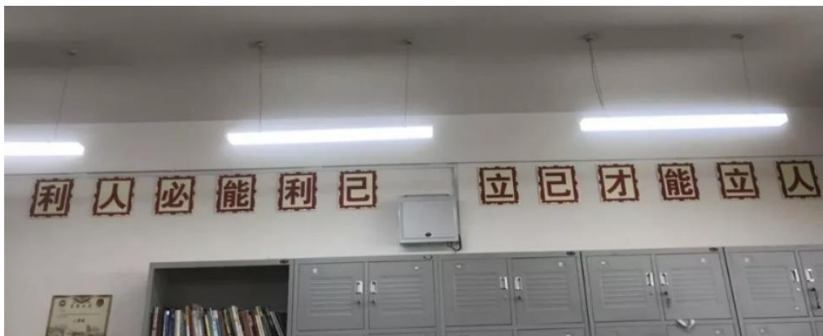
(田家炳主题班级文化布置)

整个学校多梯度、多层次、多维度传承田公精神。以田家炳先生塑像、田家炳宣传画廊实现田公精神进校园，以班级文化布置实现田公精神进教室、以开设共创课实现田公精神进课堂、以日常班团会活动实现田公精神进人心，让更多的人感受温暖、强大的田公精神。