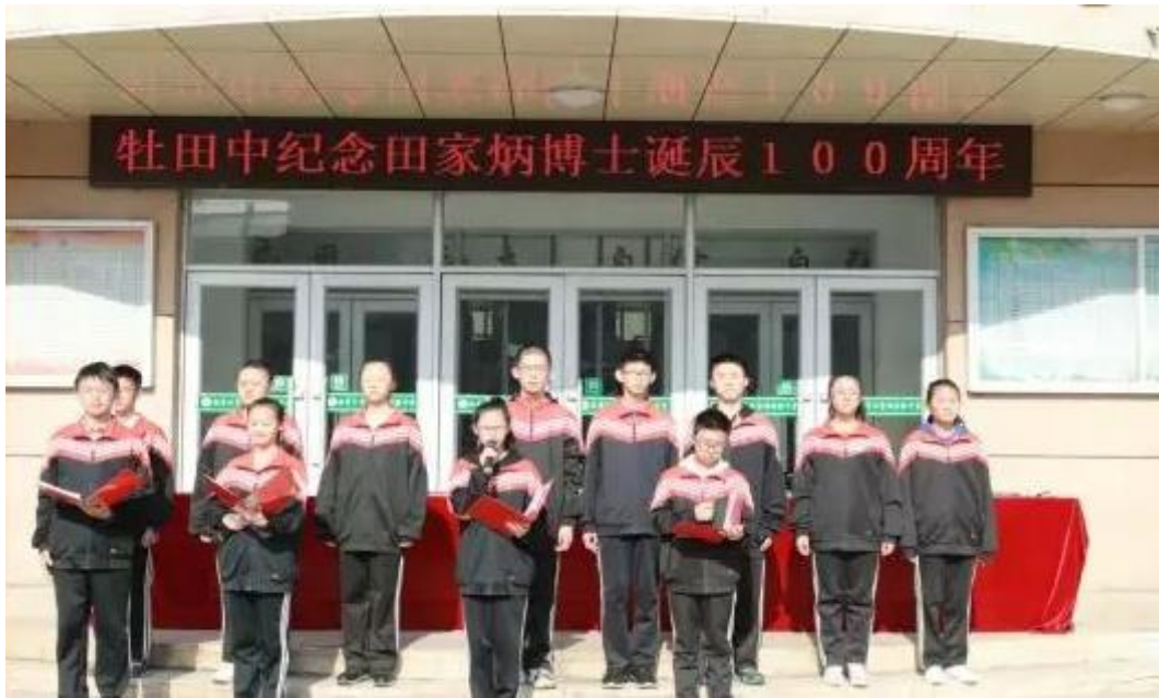
學生深青朗誦自己創作的歌詠田公的小詩