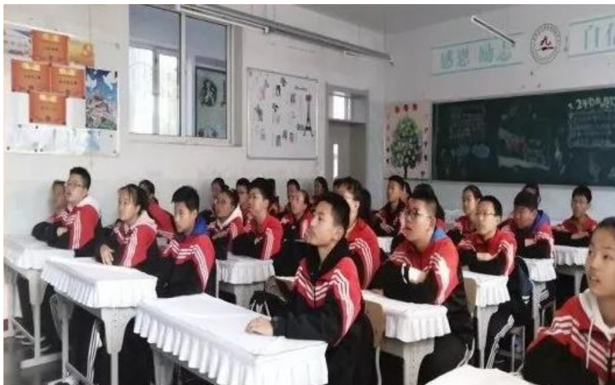
各学生有序观看田家炳博士生平简介