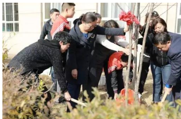
校领导，教师代表与学生代表栽种象征田公精神的丁香树