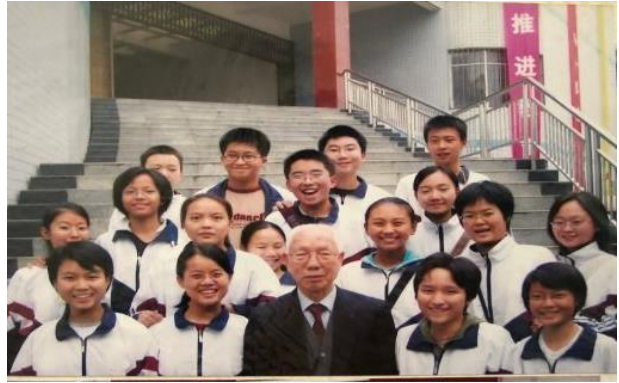
田家炳先生与我校师生合影照

2019年10月28号下午，我校全体班级召开了“仰望天空那颗明亮的星——纪念田家炳先生诞辰100周年”主题班会。同学们对田家炳先生并不陌生，在深入了解之后，愈发表现出对田家炳先生的敬重和钦佩，“这是一颗高贵的心灵，这是一个人格伟大的人”，同学们真挚而虔诚，以仰望的姿态，向伟大的田家炳先生表示致敬！