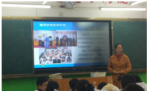
班主任老师耐心向同学们介绍田家炳先生的光荣事迹。