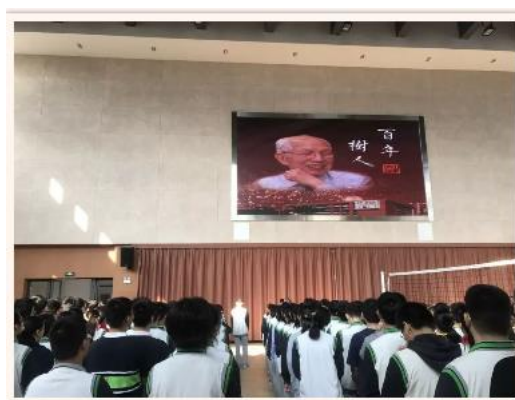
天上有颗星星 叫家炳

在周日的升旗仪式上，九5班的盛俊凯同学作题为《田家炳星 希望之星》的国旗下讲话，他为大家介绍了田家炳老先生的生平事迹，以及捐资祖国教育事业的初衷，他倡议同学们以“滴水之恩，当涌泉相报”的心态铭记田老对学校的资助和扶持，拉开了纪念活动的序幕。