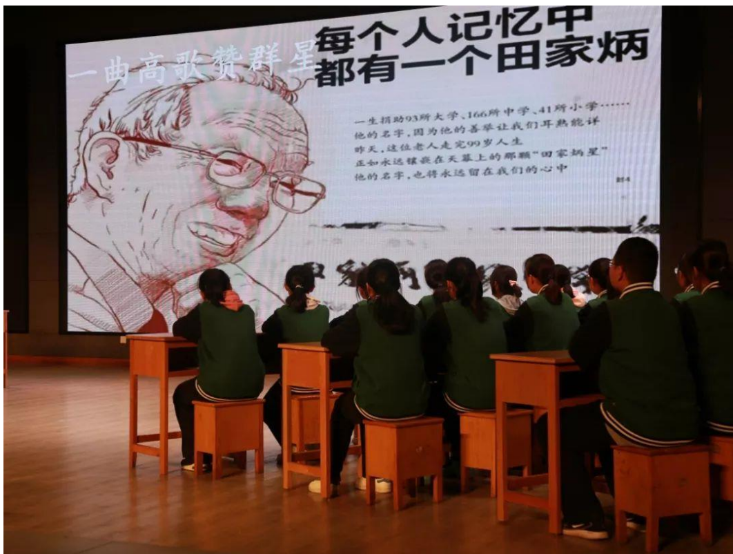
田老先生一生捐助 91 所大学、166 所中学、41 所小学，被誉为“中国百校之父”。1994 年南京紫金山天文台将 2886 号小行星命名为“田家炳星”；1996 年英国女皇亲自