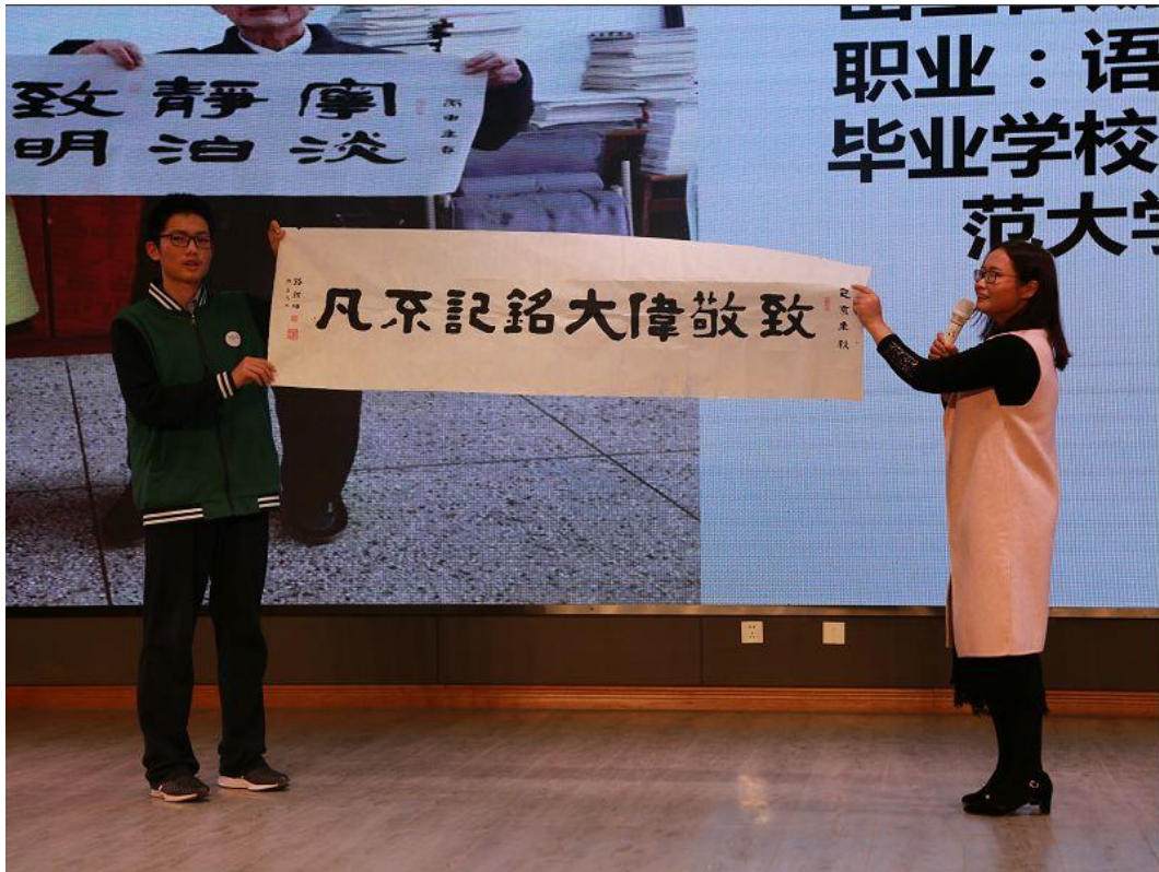
璀璨一颗星，名为田家炳。正值田老先生诞辰一百周年之际，刘老师带领同学们重温田家炳先生的光辉事迹。